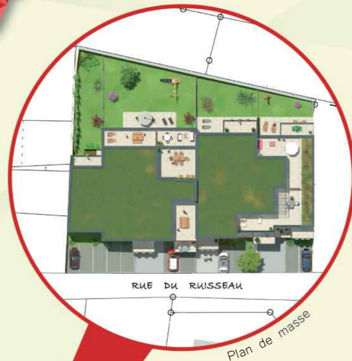
RUE DU RUISSEAU Plan de masse

Idéalement situé à deux pas de Metz, à proximité des accès aux réseaux autoroutiers (A4/A31) et du Luxembourg, la résidence L'ORIGAMI dispose des meilleurs arguments pour un investissement d'avenir.